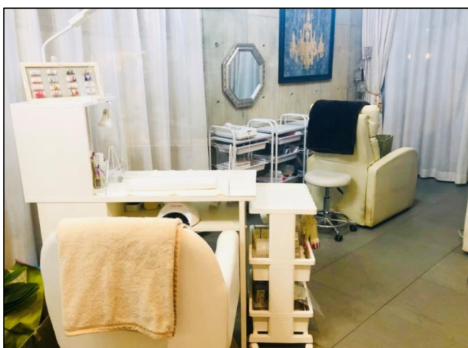
ネイルデスク サロン奥で爪のお手入れをしてもらえます