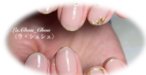
Office Nail 〈オフィスネイル〉