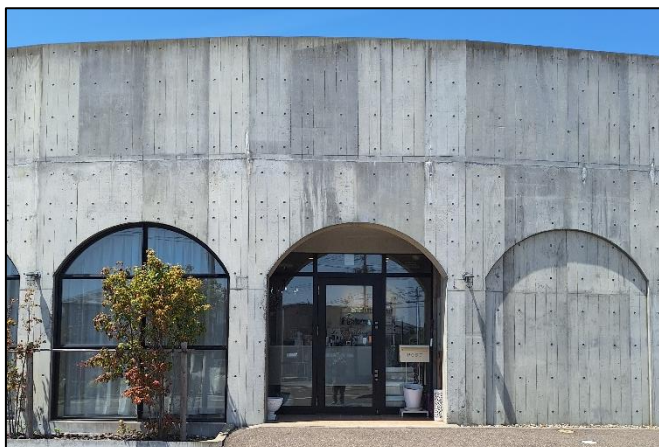
トラットリアラ・ペントラッチャ(イタリアン)と同じ 建物内にあり、ラ・シュシュ入り口は左側