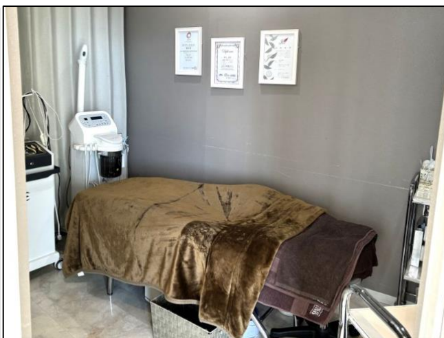
個室での施術 アイラッシュ、アイブロウ、エステ、ブライダル、脱毛などの施術