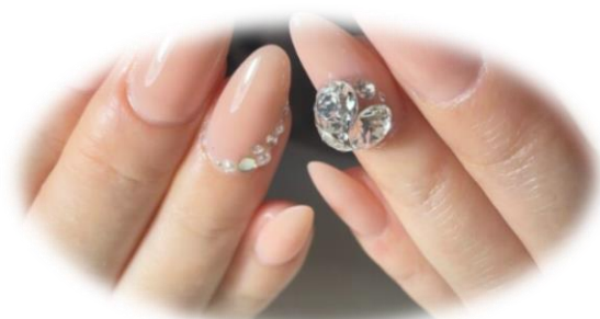
Design Nail 〈デザインネイル〉