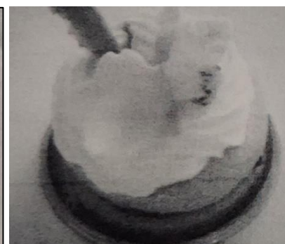
オリジナルケーキ