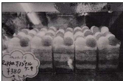
Rikka オリジナルケーキ

ターゲットを若い世代に定めた。販売促進として、地元テレビ局などのメディアの利用や無料券の配布などを行った。また、城北中学校考案、パティスリー・リ・リとの共同開発したオリジナルケーキやおいしいパンの店ソフィーと共同開発で夏をイメージしたサマーパンを販売した。