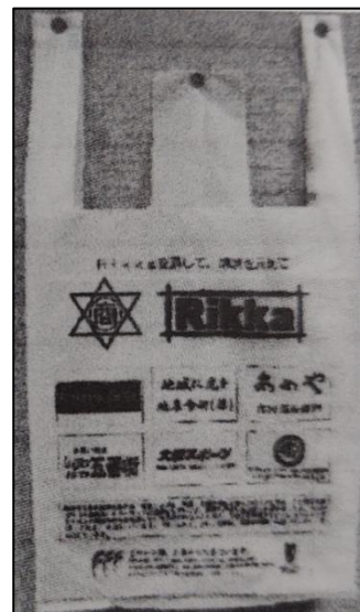
米粉を使用したレジ袋