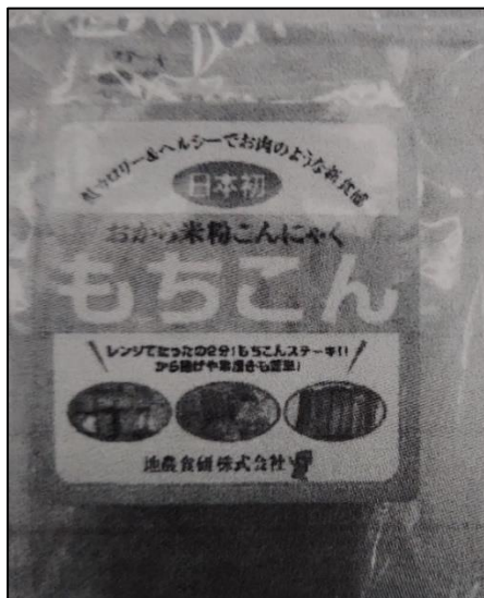
おからと米粉のこんにやく「もちこん」

日本人の主食であるコメを資源という視点でとらえ、米粉を使用した商品の提案と米粉を使用し た買い物袋を製作した。買い物袋をゴミ袋として使用できないか上越市に提案した。