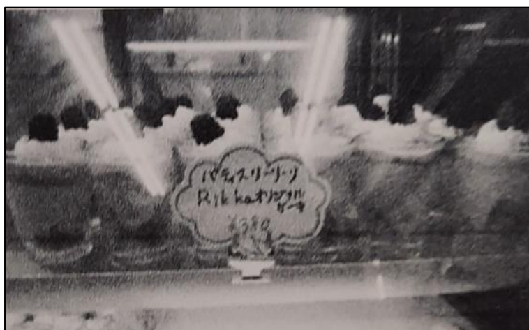
さわやか地層ケーキ

校種間連携を中心に活動し、前年度のサマーパンシリーズに加え、新たなサマーパンを開発した。また、前年度に引き続き城北中学校とパティスリー・リ・リとの共同開発によるオリジナルケーキを製作した。