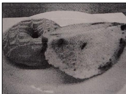
サマーパンシリーズ