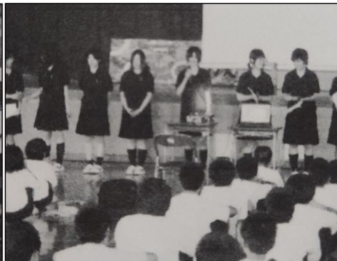
城北中学校での出前授業