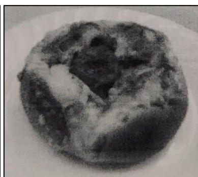
夏野菜カレーパン