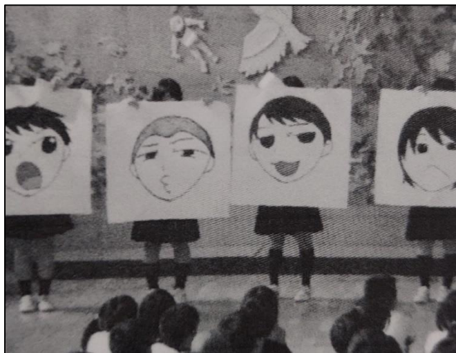
大町小学校でのマナー講習